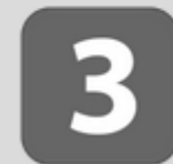
Garantia de 3 Anos