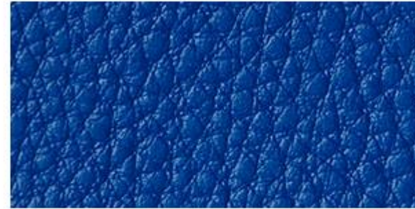
AZUL ROYAL - C.E. (058)