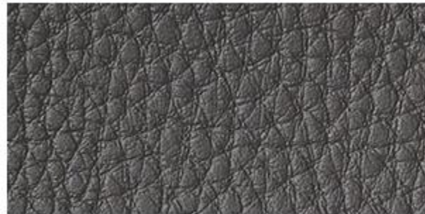
GRAFITE - D.L. (095)