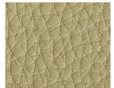
BEGE– C.E. (129)

Utilizamos couro ecológico específico para cadeiras industriais – Material de alta qualidade e resistência