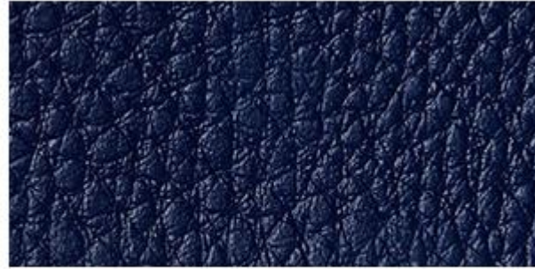
AZUL MARINHO - C.E. (042)