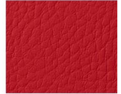
VERMELHO- D.L. (049)