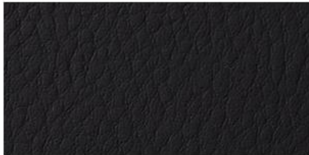
PRETO - C.E. (003)