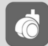
Rodízio para piso frio