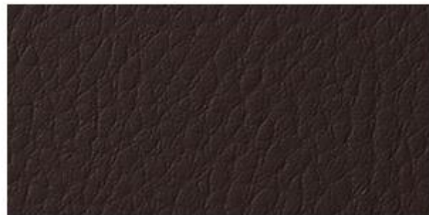
CAFÉ - C.E. (077)